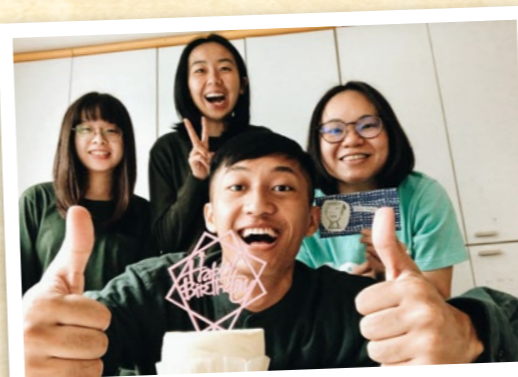
哲聖(前中)與政大團契核心團隊

然而很感恩的是，經歷了這麼多原來都是神逐步使我明白在二零一九年初抽到的經文卡，「願你堅立我手所做的工，我手所做的工願你堅立。」每當在我陷入低落情緒裡，很感恩身旁都會有一群屬