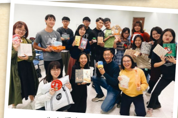
政大團契聖誕聚會

靈夥伴支持著我，用聖經的話語鼓勵我、陪伴我挪去那些焦慮和懷疑。雖然我是軟弱不全的，但是神的應許卻是信實的，在我選擇順服，放下自己舒適的權利去做神喜悅的工作時，神也一直都在透過許多人事物默默在堅立我手所做的事情。一直到現在，很感謝神社團已從原本的兩人到現在漸漸有十五位學生了。縱然服事神的工作從來都不容易，但我發現我的心境不斷在更新，因為神不僅僅在事工過程倍增了團契裡的基督徒，同時也陶塑了我的生命，使我更剛強勇敢、更明白福音之於這個世界的價值！