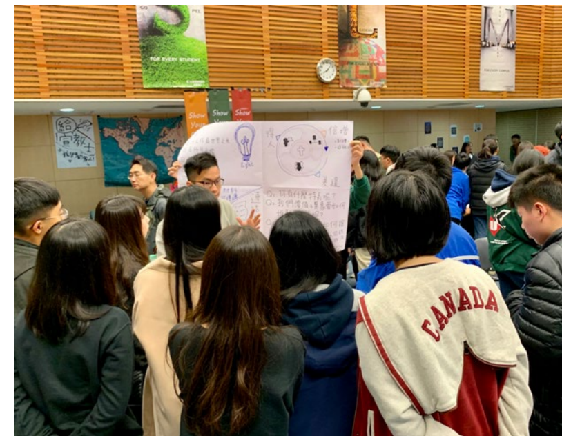
▲大學異象之旅—各校擺攤分享在校園中的異象