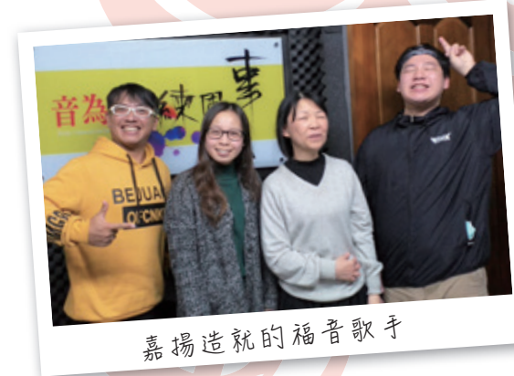
嘉揚造就的福音歌手