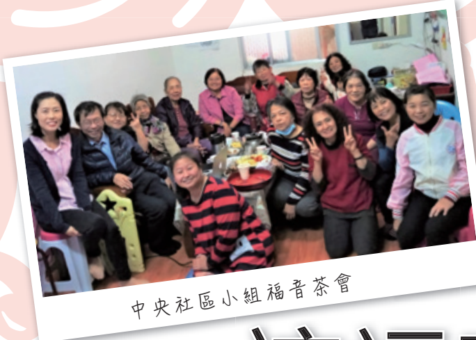
中央社區小組福音茶會