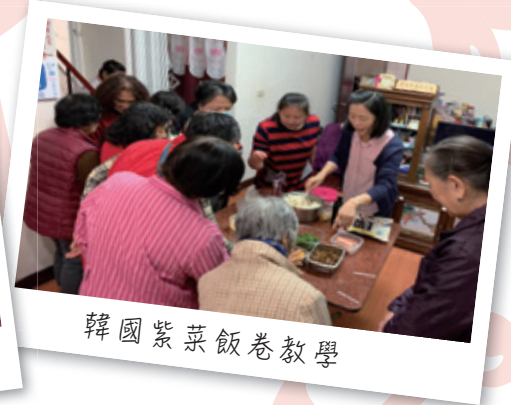
韓國紫菜飯卷教學