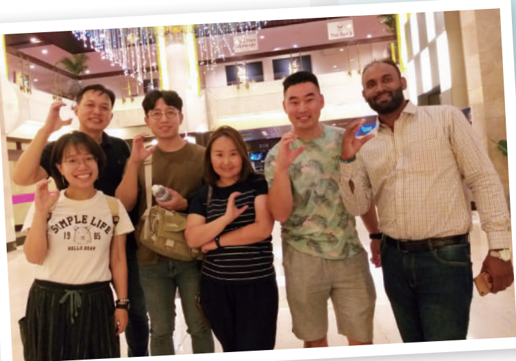
▲ 啟慧(左前一)和各國同工合照，手勢C代表學園簡稱

國際學園提供豐富的資源，我們每年都有許多同工參與國際會議和研習，在當中與他國同工一起學習。以下是去年十一月參與泰國領袖發展論壇的同工分享：