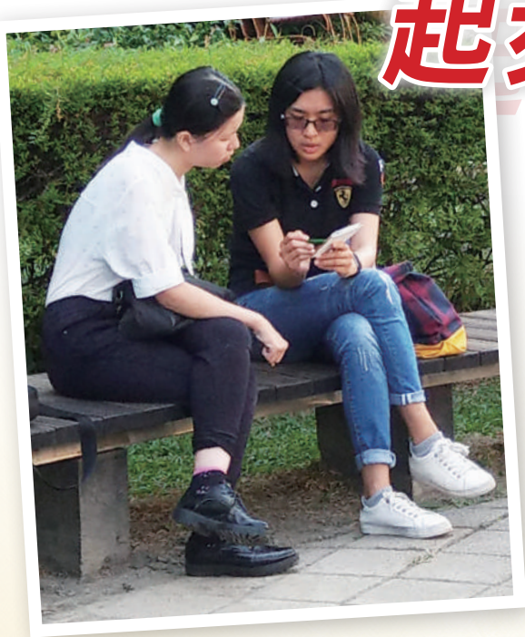
◀ 盈竺（右）福音對話後傳福音

為了幫助每位同工適才適用完成所託，學園提供新同工訓練、國外研習課程、暑期聖經課程等各種不同階段、面向的裝備，以提升學園整體的質與量，更多、更廣、更快的協助完成大使命。以下和您分享同工們的見證。