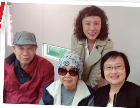
▲關懷宣教士的家人